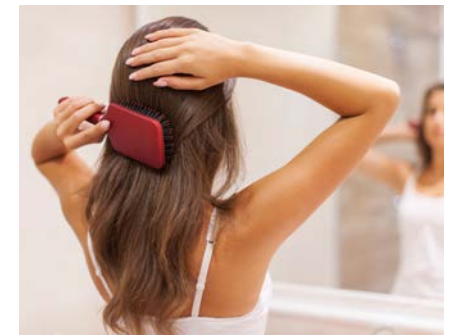
Co-Enzym Q10 unterstützt die Produktion von Keratin und stärkt somit das Haarwachstum.

Neuen Forschungsergebnissen zufolge kann Co-Enzym Q10 die Herstellung von Haarkeratin anregen. Es gibt eine Reihe von Shampoos, die mit Co-Enzym Q10 angereichert sind und die Keratinproduktion steigern sollen. Sinnvoller ist sicherlich eine hoch dosierte, systemische Zufuhr in Form von Kapseln.