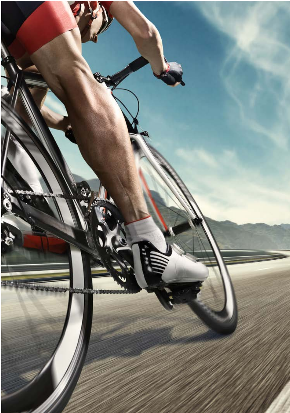
Co-Enzym Q10 wirkt wie Kerosin für die Zellen: die körperliche Belastbarkeit wird verbessert und das Herz-Kreislauf-System gestärkt.