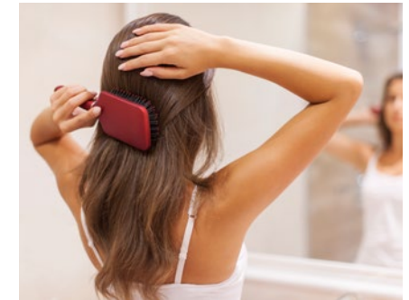
Co-Enzym Q10 unterstützt die Produktion von Keratin und stärkt somit das Haarwachstum.

Neuen Forschungsergebnissen zufolge kann Co-Enzym Q10 die Herstellung von Haarkeratin anregen. Es gibt eine Reihe von Shampoos, die mit Co-Enzym Q10 angereichert sind und die Keratinproduktion steigern sollen. Sinnvoller ist sicherlich eine hoch dosierte, systemische Zufuhr in Form von Kapseln.