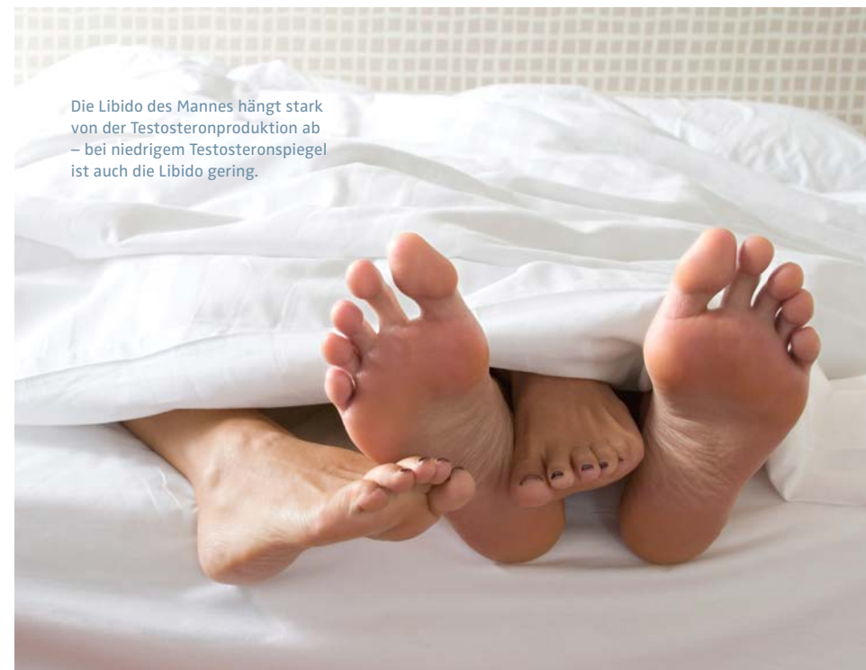
Die Libido des Mannes hängt stark von der Testosteronproduktion ab – bei niedrigem Testosteronspiegel ist auch die Libido gering.

Männer mit einer niedrigen Testosteronkonzentration sterben häufiger an Tumor- oder Herz-Kreislauf-Erkrankungen als Männer mit einer physiologischen Konzentration dieses Sexualhormons. So ist ein niedriger Testosteronspiegel häufig mit einem erhöhten allgemeinen Krankheitsrisiko assoziiert. Dies wurde in einer Studie mit 930 Männern mit koronarer Herzkrankheit (KHK) bestätigt. Über einen Zeitraum von sieben Jahren wurden alle Todesfälle erfasst und mit dem Testosteronwert korreliert. In der Gruppe mit Hormondefizit war die Mortalitätsrate fast doppelt so hoch wie in der Gruppe mit normalen Testosteronspiegeln. Ob eine Substitution mit Testosteron zu einer verringerten Mortalität bei KHK-Patienten führt, muss jedoch erst noch in weiteren Studien überprüft werden.