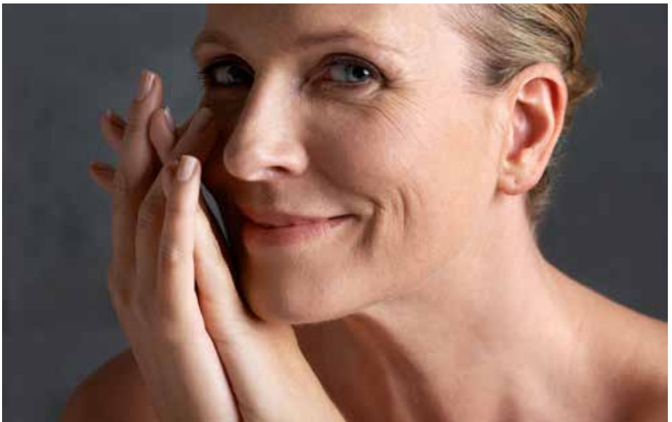
DHEA ist eine Anti-Aging-Substanz für die Haut.

Die Umwandlung des DHEA in Androgene, u. a. auch Testosteron, führt zu einer Erhöhung der sexuellen Lust, der Orgasmusintensität und sexuellen Aktivität. Bei manchen Frauen