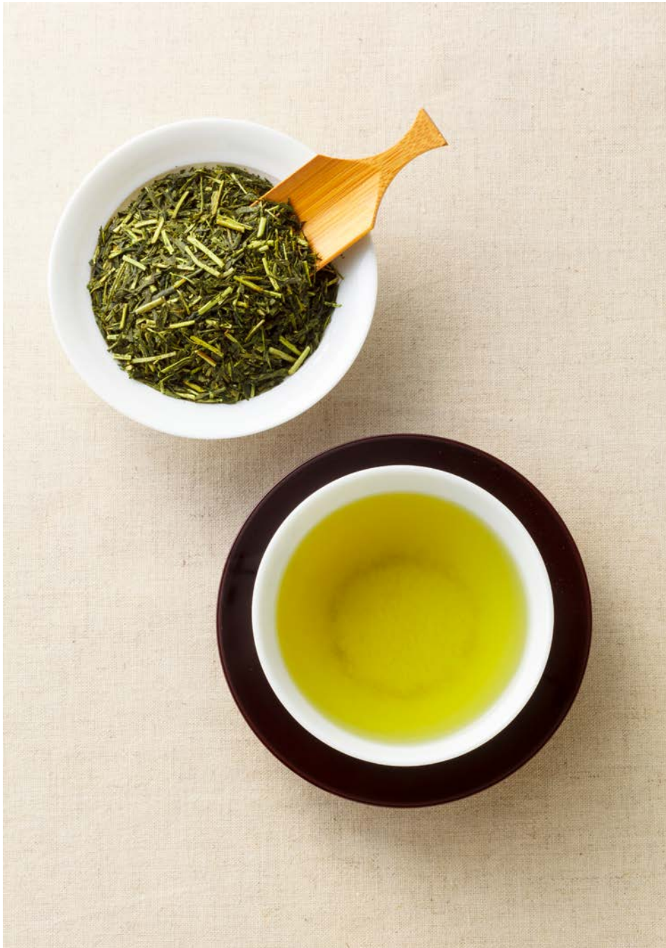
Abwarten und Tee trinken? Neueste Studien zum Grüntee-Extrakt EGCG klingen vielversprechend im Kampf gegen verschiedenste Krankheiten.