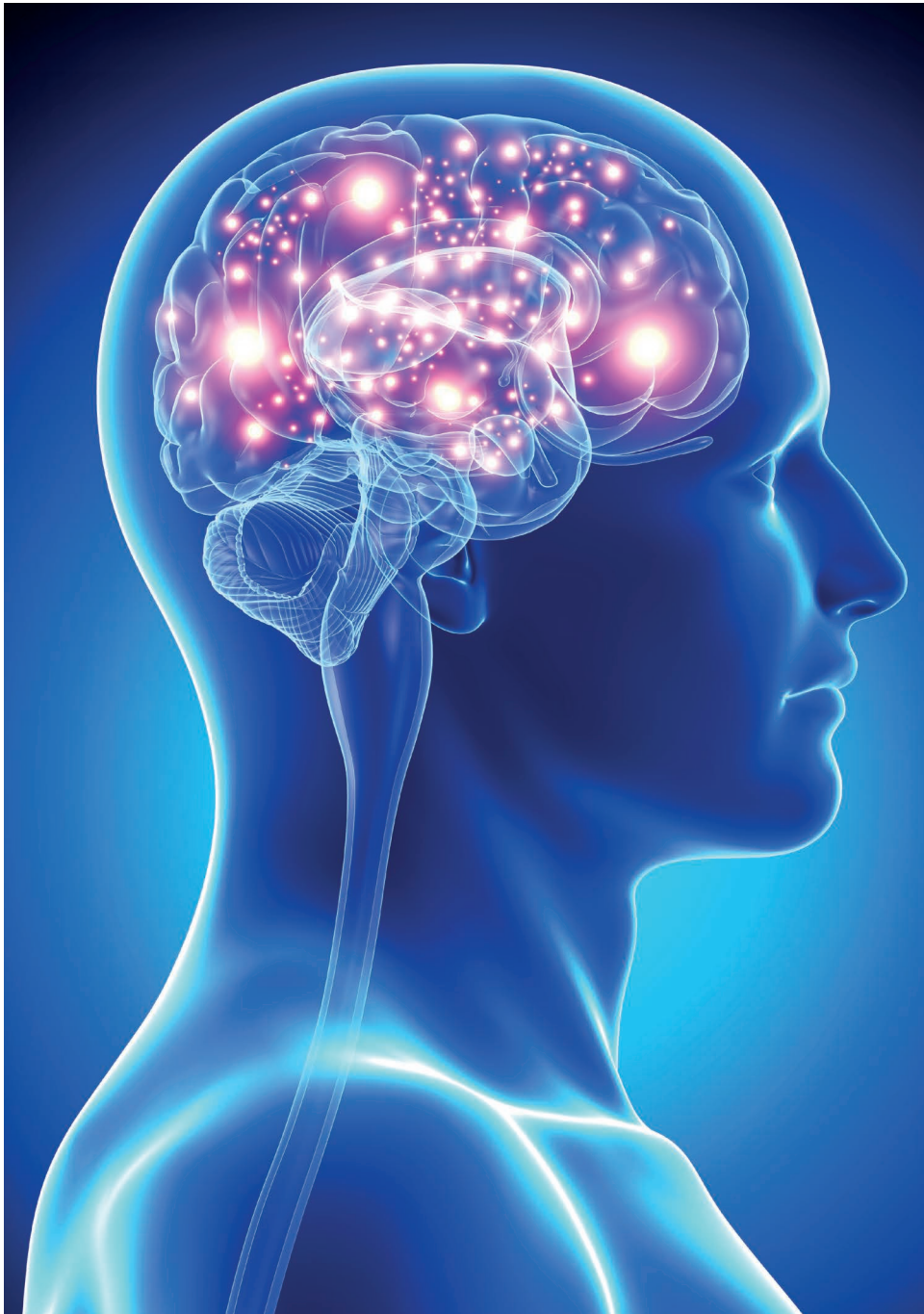
Pregnenolon gehört zu den effektivsten Hormonen zur Verbesserung des Gedächtnisses.